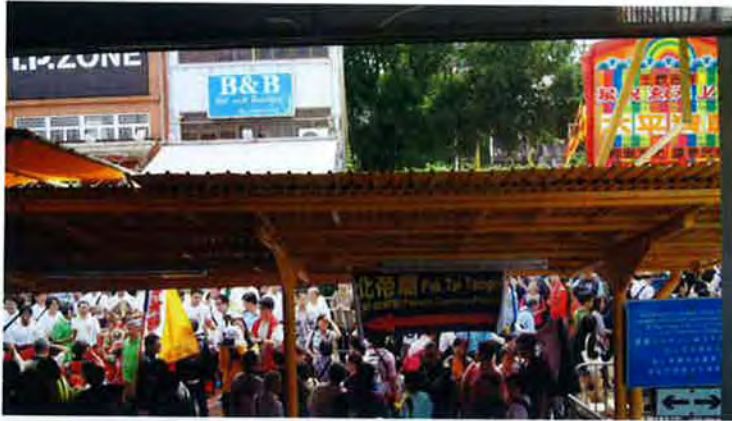
長洲碼頭外人頭湧湧