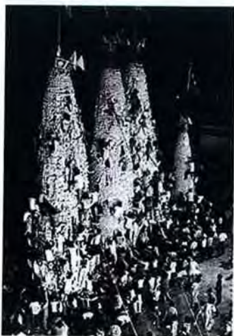
左圖為1978年包山倒塌意外前的搶包山比賽