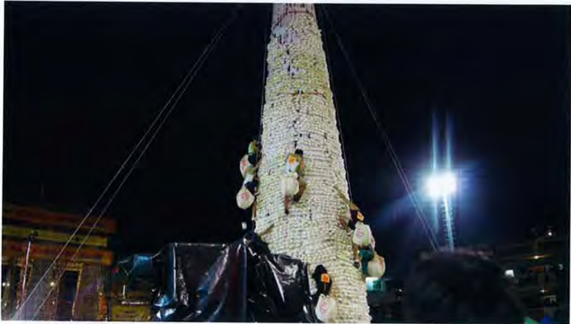
圖為今年的搶包山比賽

在長洲商店到處都能看得到平安包的蹤影，它已成為太平清醮的象徵，平安包包如其名寓意平安福氣，而它亦有另一個名稱-幽包，因為它作為祭幽之用 其實平安包亦有隨時間改變，餡料本來只有蓮蓉和麻蓉，但現在餡料五花八門，如奶黃、蓮蓉、芝麻，而想品嚐平安包的市民亦不用千里迢迢去長洲購買，皆因平安包港九新界榮華有售。平安包亦成為眾商店增加收入的機會，不少商店推出了平安包造形的枕頭、零錢包、飾物，帶來大量商機，成為商品化的象徵。