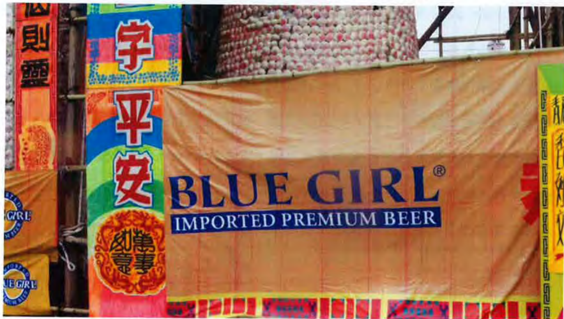
某商家在包山前的廣告