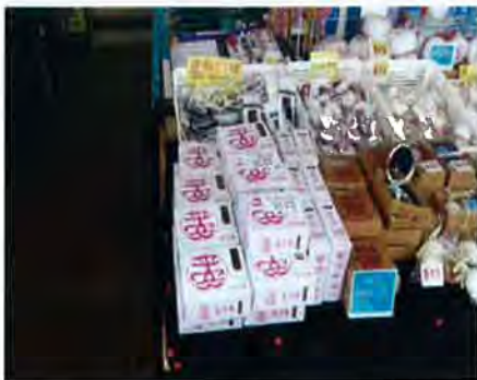
長洲商戶出售各式各樣的紀念品

兩位最後都表示雖然有些紀念品出現以後，和我們原本的傳統習俗有少許區別，但核心意義還是沒有改變，而且塑膠紀念品在現時來說是與時並進。