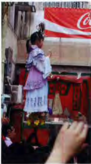
攝於今年的會景巡遊

以前的飄色巡遊的形式較為簡樸單調，通常由四人抬轎，前後各有兩人。而飄色巡遊發展至今，形式上已經加入了不少創新的元素，舊時的四人抬轎已變成推轎移動；承托小孩的色梗能夠旋轉，花車的裝飾也較多。另外，現時的飄色巡遊隊伍也加入不少樂隊，例如牧童笛隊、土風舞隊、銅管樂隊。由此可見飄色巡遊形式上的改變還算不少。