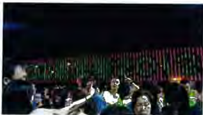
是宗教儀式還是嘉年華？

為了要保存太平清醮這份珍貴的文化寶藏，我們建議有關部門採取以下的措施。首先，政府應當把長洲太平清醮等非遺及傳統習俗交給主理文化事務的部門（如康文署），確立其文化地位。政府應該加強對傳統習俗的宣傳，而不至流於經濟掛帥。同時，政府可以設立導賞團，引導遊客更深入地了解太平清醮。政府可以回應當地人士的請求，在當地設立「太平清醮博物館」，或在其他的博物館展出各種照片、文物，推廣太平清醮，既能吸引遊客，又能加深他們對文化的了解。